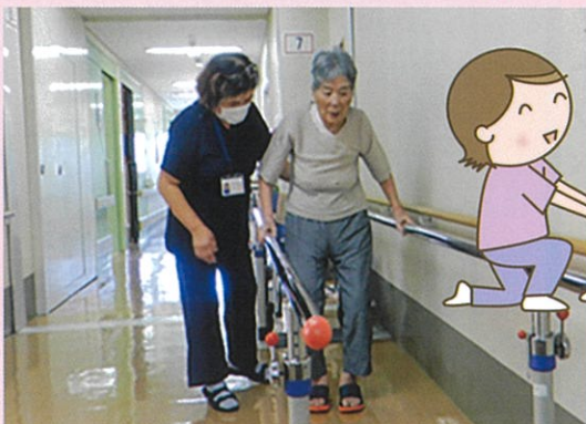
車いす無しで歩けるようになりますように