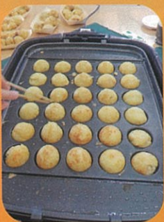
コロナ対策を万全にして 久々のたこ焼きパーティー