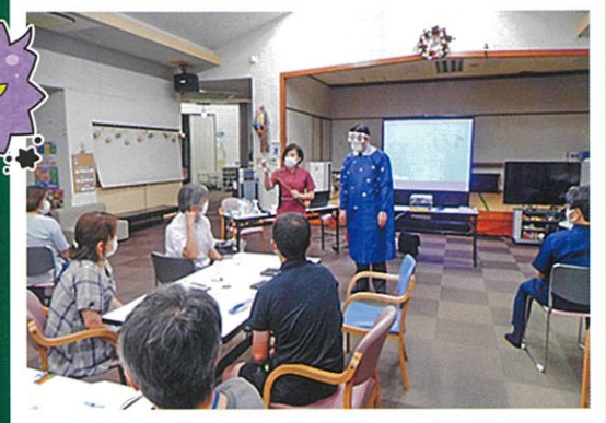
職員全員で感染対策に努めます！