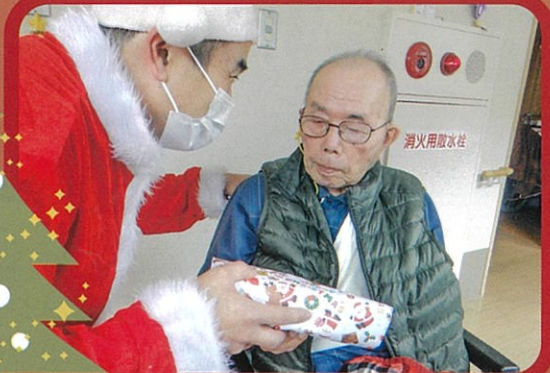
何が入ってるが楽しみ!

3年連続になりますが、新型コロナウイルスの影響で夏祭り、敬老会も中止となりました。 クリスマス忘年会だけは出来ると思っていましたが… 早く新型コロナウイルスが、終息する事を願っています。