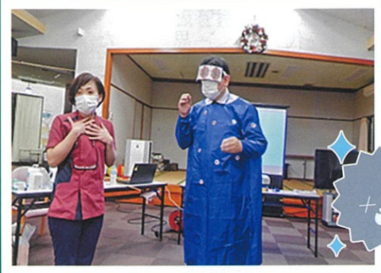
認定看護師を招いての勉強会 実はモデルは！