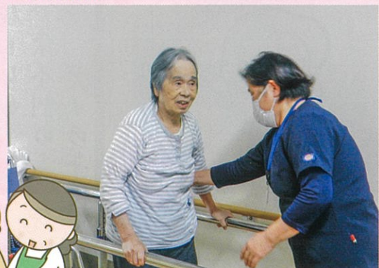
リハビリ頑張っています