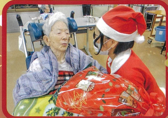
可愛いサンタからのプレゼント!