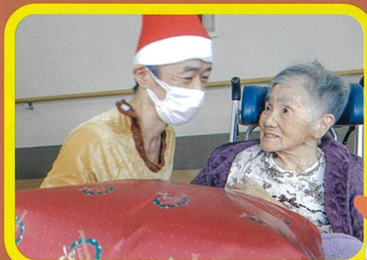
よかにせにビックリ!