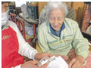
お薬は飲みましたか？