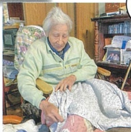
オイがすっじゃい