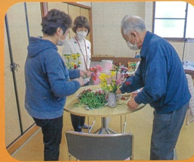
みんなが先生！綺麗にお花 を活けてもらいました