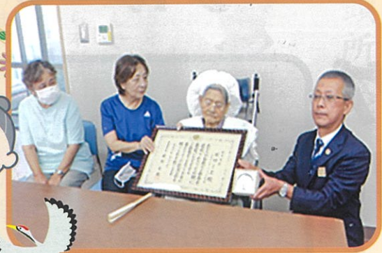
内閣総理大臣からのお祝い！