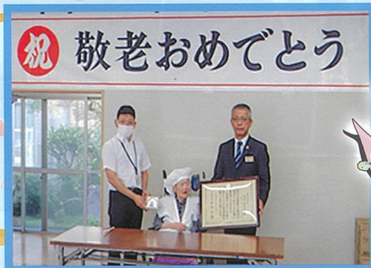
いつまでもお元気でいて下さい