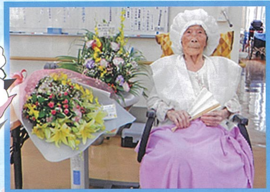
家族からお花のプレゼント