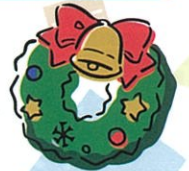
年末はクリスマス忘年会で1年の締めくくり