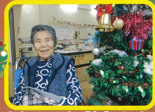
クリスマスツリーが完成しました。